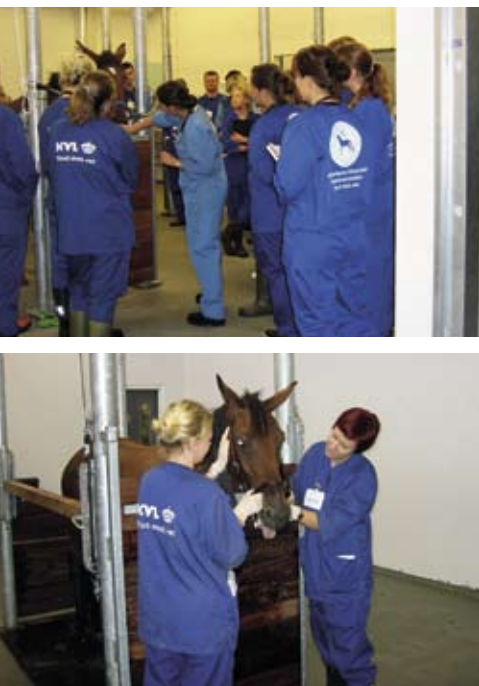
Hospitalets primære funktion er uddannelse af dyrlægestuderende.