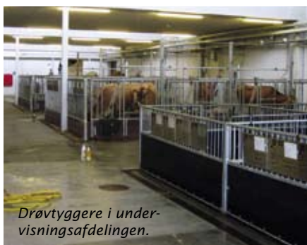
Drøvtyggere i undervisningsafdelingen.