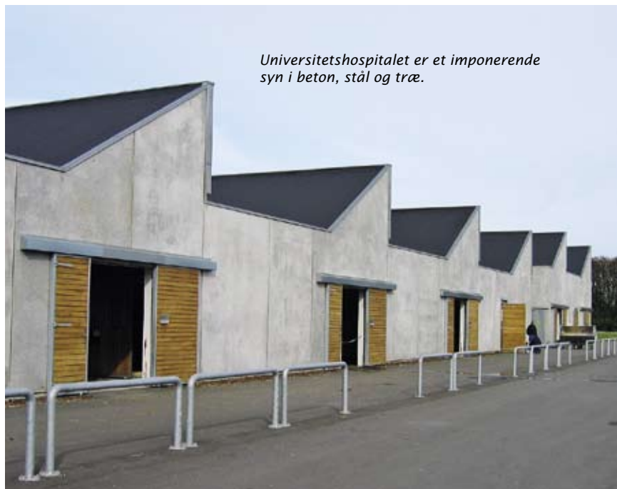
Universitetshospitalet er et imponerende syn i beton, stål og træ.